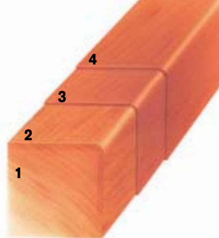
1 - surové drevo 2 - namáčací základ 3 - intermedio - chráni drevo dookola proti vlhkosti 4 - hrubovrstvová lazúra

Následne štetcom jedenkrát nanesieme namáčací základ. Po po-